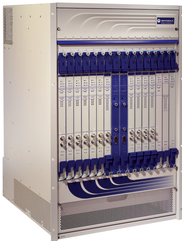
Motorola BSR 64000

BSR 64000を導入することにより通信事業者はキャリアクラスの高使用率で運用可能な、スケーラブルでコスト効率に優れたシステムを用いて、HFCネットワーク上で音声とデータの統合化サービスを提供できます。この高実装密度で完全な冗長構成を備えたCMTSインテリジェント・エッジ・ルータにより、ケーブル通信事業者は企業および一般住宅加入者の両方に対して、データ、音声、およびマルチメディアを統合化した、他社との差別化が可能なサービスを迅速に提供することが可能となります。BSR 64000は、顕在化しつつあるVoIPのような売上増加につながるサービスの需要をサポートするために要求される強力なルーティング機能、柔軟性、および拡張性を備えています。