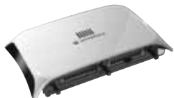
Rádio Dual AP 7131