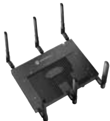
Rádio Simple AP 7131 (mostrado sem frente)